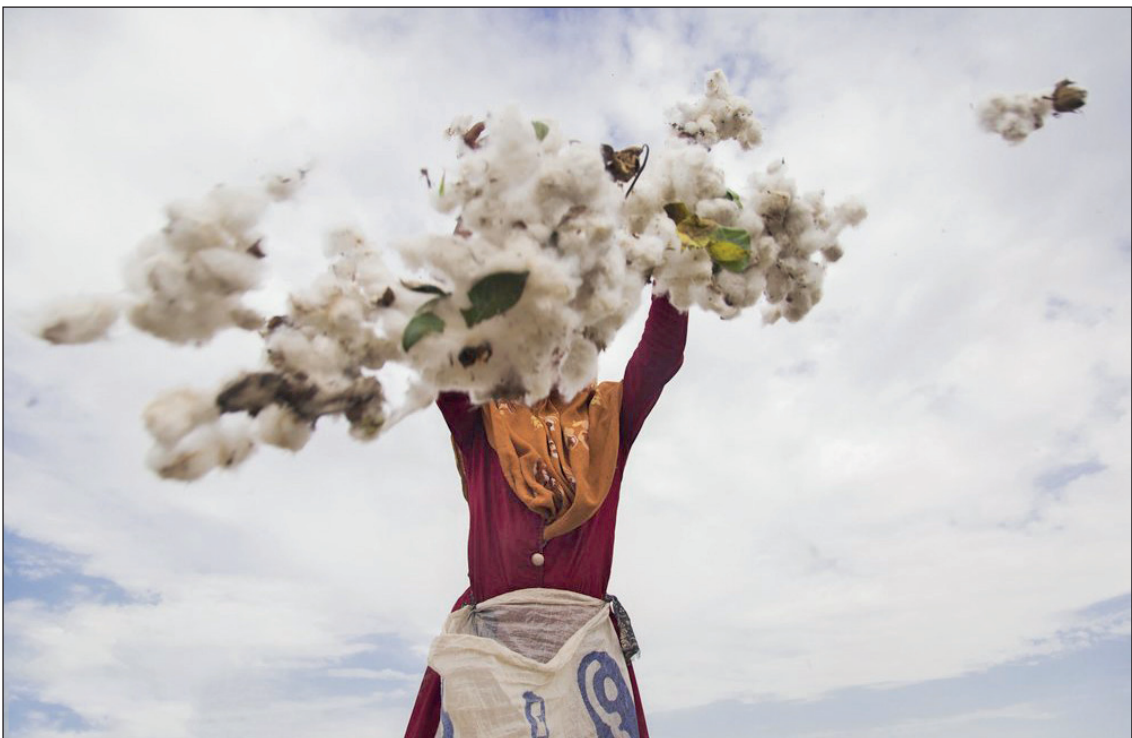
پنبه؛ چرخ زندگی و اشتغال در گرگان